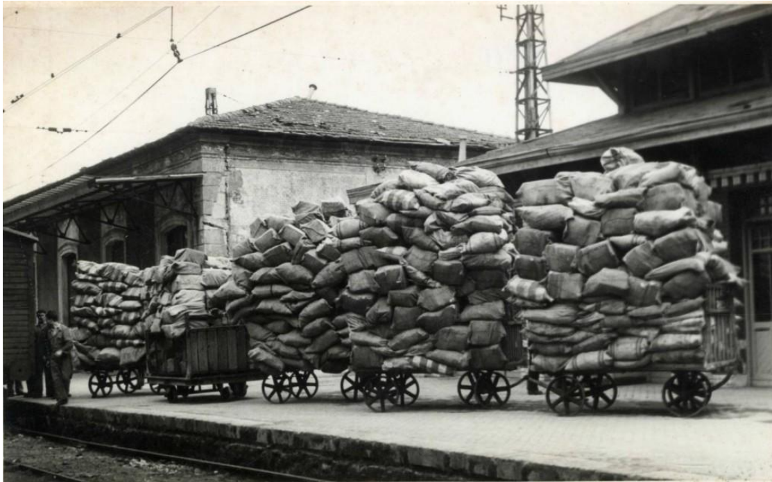
Funcionaris de correus preparen un dels enviaments de cartes i paqueteria en Irún, anys 40.